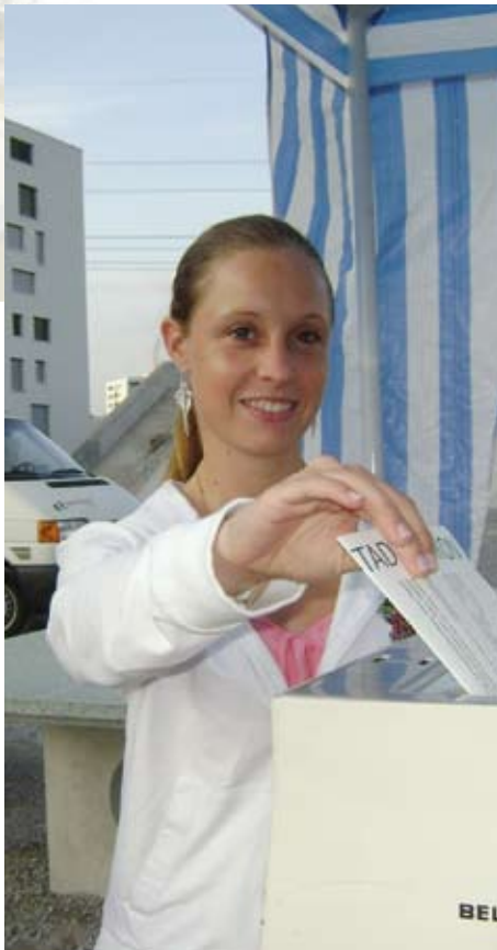
Eine Teilnehmerin an der Befragung wirft den Glattpark-Barometer in die Urne.

Zusammen mit einer Steuerungsgruppe des Stadtrats und dem Quartierverein Glattpark wurde das schriftliche Befragungsinstrument Glattpark-Barometer von cultur prospectiv entwickelt. Für jeden Haushalt wurde zufällig eine Person ausgewählt, welche die Fragebroschüre beantworten konnte. Rund drei von zehn beteiligten sich an der Befragung und man konnte im Frühjahr 2010 vor einer grossen Anzahl Interessierter die Resultate vorstellen. Die Ergebnisse liegen in einem Bericht vor, der bei der Stadt Opfikon erhältlich ist.*